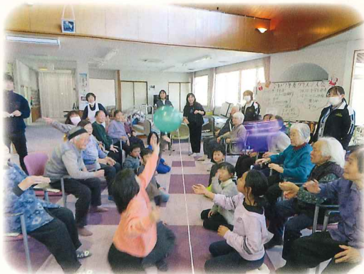
小学3年生との交流