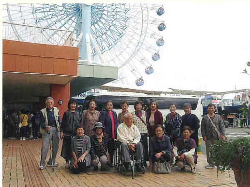
南相木村シニアクラブ 日帰り旅行

十月六日のシニア交流ゲートボール大会では、ゲートボール連盟の皆さんに運営等のご協力をいただき、二十九名の皆さんの参加がありました。初めての方も先輩方にご指導いただきながら、楽しい交流会になったと思います。